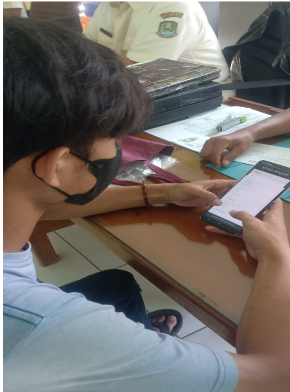
Gambar 1.1 Dokumentasi Responden saat Mengisi Data